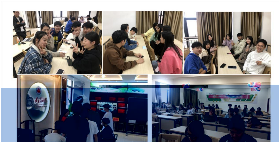
中国欧洲语言选修课程